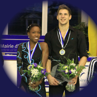
Nathalie PECHALAT / Fabian BOURZAT - Tiffany ZAHORSKI / Alexis MIART - Vanessa JAMES / Morgan CIPRES